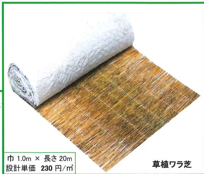
盛土法面用筋状緑化シート